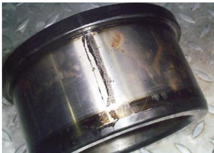
Skadad innerring från lager på växellådans utgående generatoraxel.